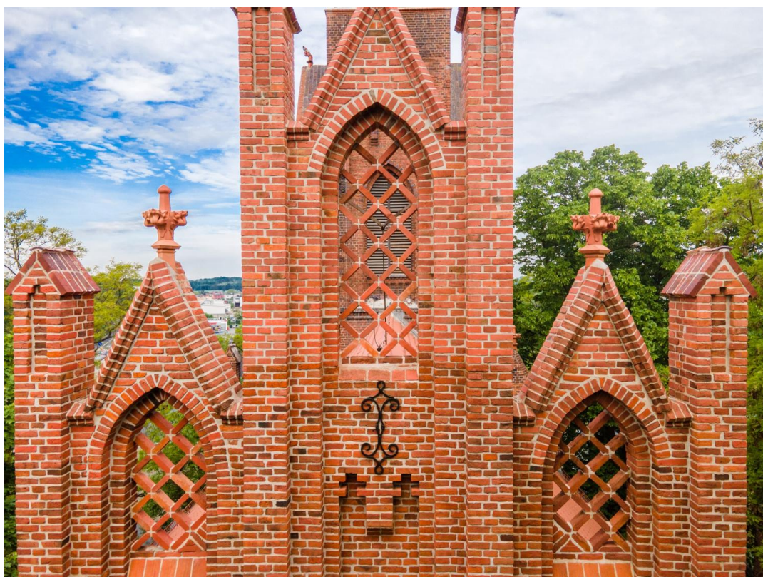
Odbudowana attyka kościoła ewangelickiego w Miłostawiu