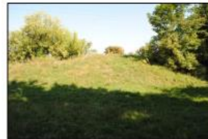
Zieliniec: Grodzisko