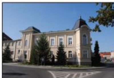
Września: Starostwo Powiatowe

Obiekt w strefie ochrony konserwatorskiej historycznego układu urbanistycznego miasta. Nie znamy dokładnej daty powstania budynku starostwa. Nastąpiło to prawdopodobnie w latach 60. XIX w. W 1912-1913 r. budynek landratury przebudowano ze środków przeznaczonych wcześniej na budowę we Wrześni nowego szpitala. Obok budynku władz powiatowych w 1913-1914 r. pobudowano willę dla starosty powiatowego (dziś budynek gminy, m.in. USC). Główne wejście do starostwa znajdowało się od ul. Ewangelickiej (3 Maja). Obok wejścia umiejscowiono balkon z czterema jońskimi kolumnami zwieńczony trójkątnym tympanonem. Ściany ubogacone były licznymi boniami, gzymsami i pilastrami. Budynek od ulicy otoczony był metalowym, kutym parkanem z mурowanymi słupkami. W 1939 r. po remoncie budynku zubożono jego wielość form architektonicznych. Zlikwidowano kolumny z tympanonem, uproszczono gzymsy nadokienne i pilastry. Rozebrano parkan otaczający starostwo. W 1962 r. pobudowano łącznik pomiędzy budynkiem starostwa a dawną willą starosty tworząc jeden kompleks budynku urzędu (Chopina 9 i 10).