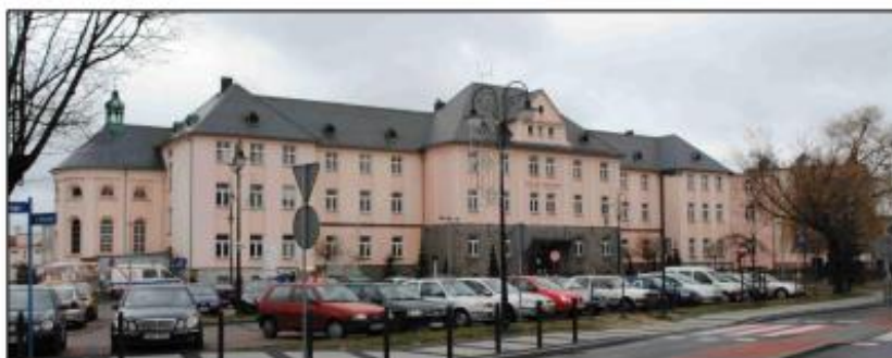
Września: Stary budynek Szpitala Powiatowego

Obiekt w strefie ochrony konserwatorskiej historycznego układu urbanistycznego miasta. Budynek wzniesiony w l. 1925-1929 wg projektu Józefa Gierczyka. Jest to budynek wieloczęłowy (skrzydło główne, do niego przylegające prostopadle skrzydła boczne, skrzydło zbudowane na podstawie starego budynku szpitalnego oraz kaplica zamknięta półkoliście), na wysokim podpiwniczeniu, dwupiętrowy, kryty wysokim dachem wielopołaciowym krytym łupkiem, na dachu kaplicy wieżyczka. Elewacja frontowa osiemnastoosiowa z ryzalitem centralnym i dwoma bocznymi.