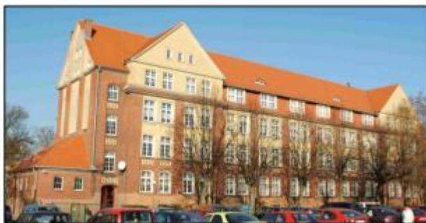
Września: Blok żołnierski w zespole koszar wojskowych (1) obecnie Zespół Szkół Zawodowych nr 2 im. Powstańców Wielkopolskich

Obiekt w strefie ochrony konserwatorskiej historycznego układu urbanistycznego miasta. Budynek powstał w 1910 r. jako blok żołnierski. Obiekt monumentalny, na rzucie litery E, dwupiętrowy, kryty wysokim dachem namiotowym. Cechuje go surowość, prostota i oszczędność w detale architektoniczne.