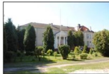
Zieliniec: Park krajobrazowy