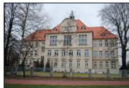
Września: Liceum Ogólnokształcące im. H. Sienkiewicza

Obiekt w strefie ochrony konserwatorskiej historycznego układu urbanistycznego miasta. Budynek zbudowany w 1911 r. wg projektu Paula Pitta z Poznania. Dwupiętrowy budynek na rzucie zbliżonym do litery U, składający się z trzech prostokątnych skrzydeł. Frontowe skrzydło wzbogacone prostokątnym ryzalitem. Budynek nakrywa wysoki dach wielopołaciowy, kryty dachówką, na szczycie dachu skrzydła głównego wieżyczka wentylacyjna. Wejścia do budynku od ul. Szkolnej i od ul. Witkowskiej ujęte w portalowe obramienia.