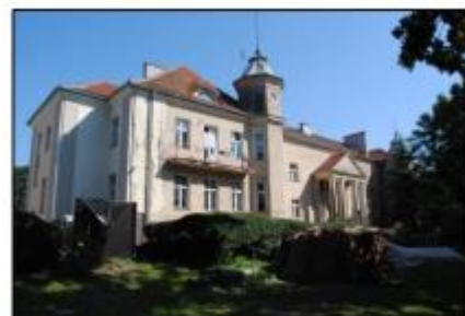
Zieliniec: Pałac

Na terenie parku znajduje się pałac, nie wpisany do rejestru zabytków, zbudowany na pocz. XX w. w stylu eklektycznym. Obecnie piętrowy. Elewację frontową zdobi czterokolumnowy portyk. Jednak bryła budynku została zeszpecona przebudowami.