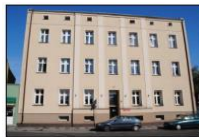
Września: Dawny Ośrodek Zdrowia przy ul. 3 Maja

Obiekt w strefie ochrony konserwatorskiej historycznego układu urbanistycznego miasta. Kamienica z początku XX w. Pierwotnie jako budynek piętrowy kryty dachem namiotowym. W I. 30. XX w. nadbudowano drugie piętro. Po II wojnie światowej pełnił rolę ośrodka zdrowia.