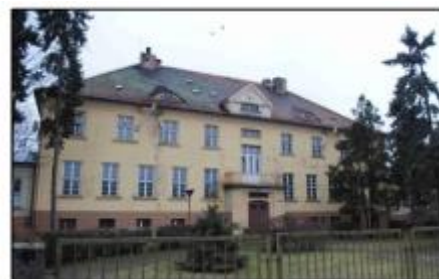
Września: Dawna Szkoła Mleczarska