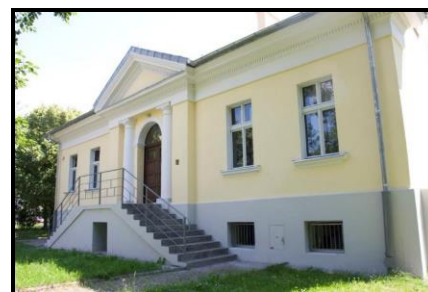
Kołaczkowo: Budynek dworski, czyli oficyna

Budynek z 1820 r. wchodzący w skład zespołu parkowo-pałacowego. Budynek o formach klasycystycznych. Parterowy, na wysokim podpiwniczeniu, nakryty dachem naczółkowym. Wejście główne na osi ujęte przyściennymi kolumnami. Nad wejściem trójkątny ryzalit.