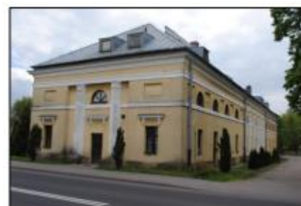
Kołaczkowo: Dawna stajnia dworska

Budynek z poł. XIX w. wchodzący w skład zespołu parkowo-pałacowego. Obiekt o formach klasycystycznych nakryty dachem naczółkowym. Elewacje rozczłonkowane pilastrami ujmującymi osie okienne: prostokątne na parterze, półkoliste na piętrze. Wejścia w szczytach ujęte przyściennymi kolumnami