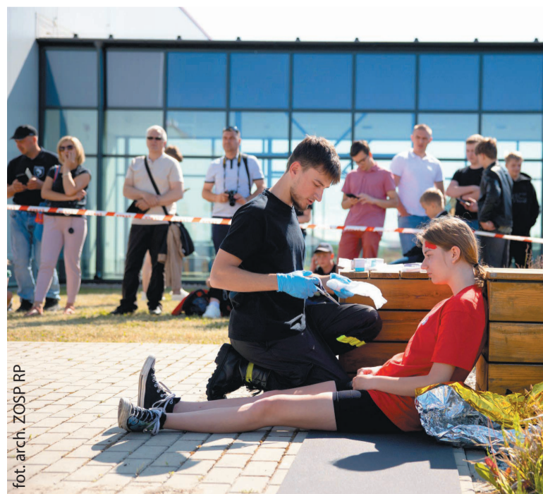
Konkurs pozwalał sprawdzić praktyczne umiejętności