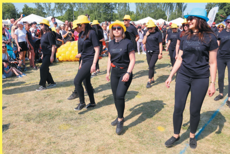
Po raz kolejny urzędnicy zaprezentowali się w tańcu