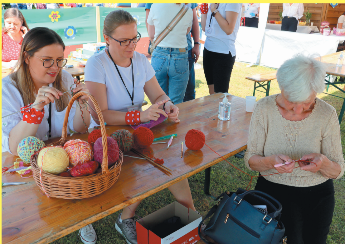
Szydełkowanie w Strefie Seniora