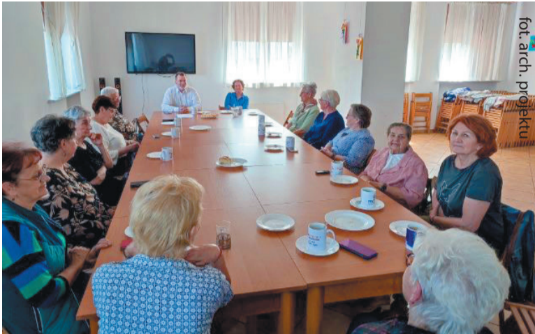
Uczestnicy w miłej atmosferze mogli zadawać nurtujące ich pytania

Kolejne spotkanie z prawnikiem odbyło się 26 maja w Miłosławskim Centrum Kultury.