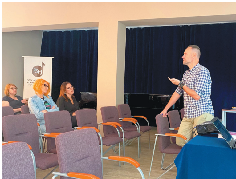
Podobne spotkania są pracownikom jednostek bardzo potrzebne

Powiatowe Centrum Pomocy Rodzinie we Wrześni zorganizowało spotkanie dla przedstawicieli wszystkich jednostek pomocowych działających na terenie powiatu wrzesińskiego.