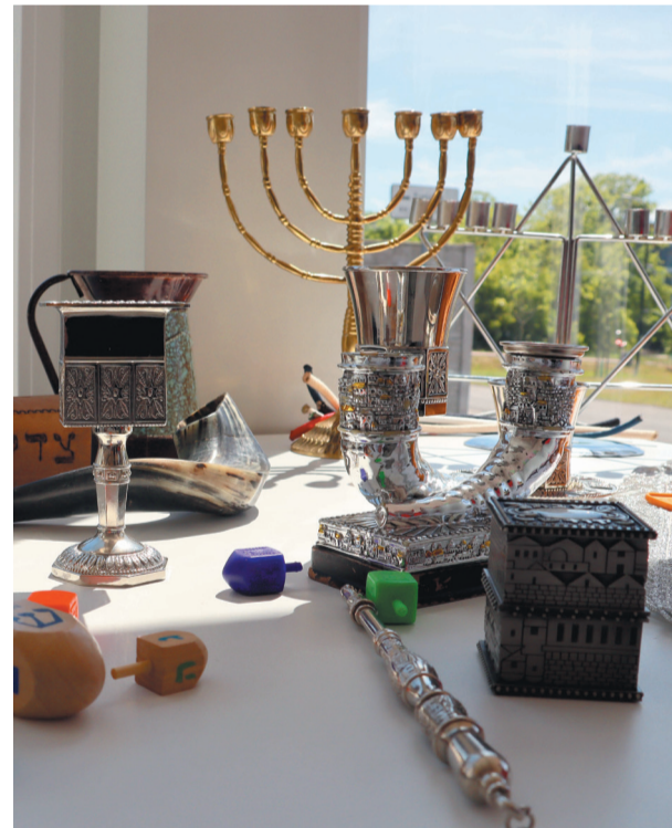
Judajka w Muzeum na kółkach