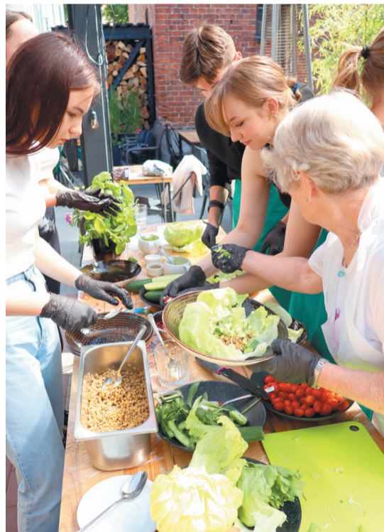
Kuchnia jest ważną częścią każdej kultury