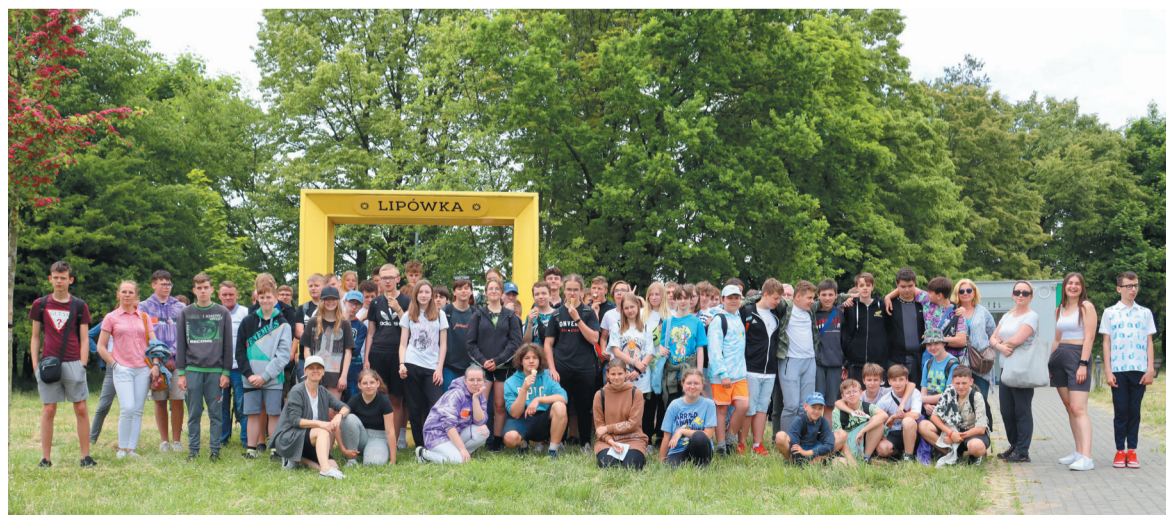
Po zakończonym queście