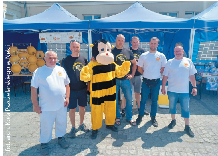
Pszczelarze z powiatu wrzeńskiego chętnie opowiadają o swojej pasji

Pierwsza edycja imprezy zorganizowanej przez Koło Gospodyń Wiejskich „Dolina Wrześnicy” miała charytatywne przesłanie.