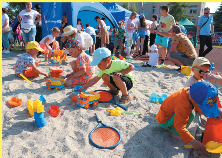
Na stadionie przy Kaliskiej można było poczuć się jak na plaży

Impreza odbyła się 4 czerwca na stadionie lekkoatletycznym Zespołu Szkół Technicznych i Ogólnokształcących we Wrześni.