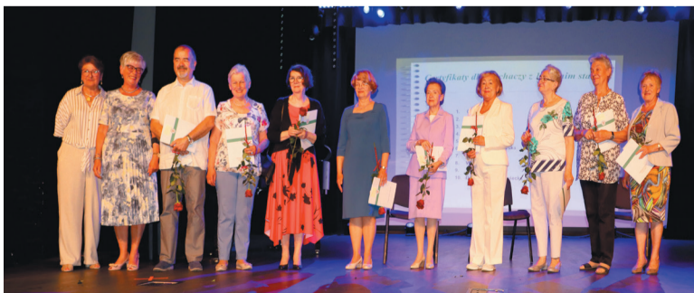
Wyróżniono studentów seniorów z długim stażem nauki