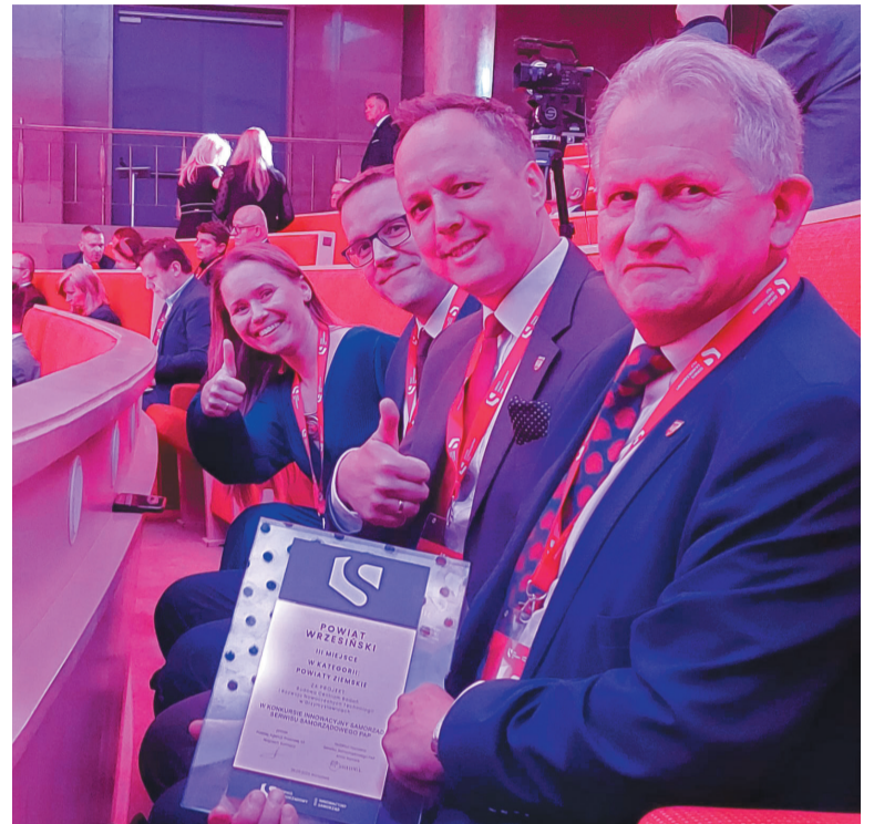
Zadowolona reprezentacja powiatu

Ponadto za maj 2023 powiat wrzesiński został wyróżniony certyfika-