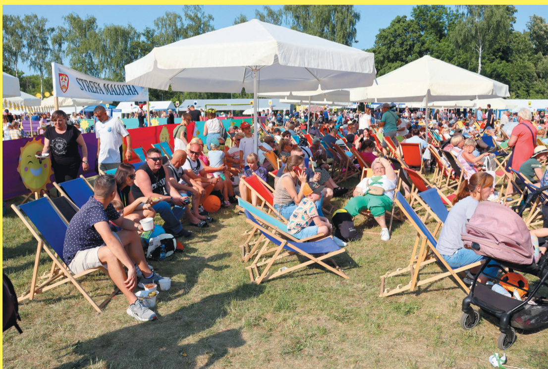
Był czas i na aktywności, i na odpoczynek