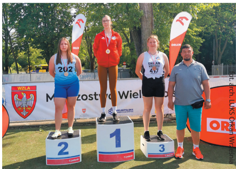
Wrzesiński klub jest kuźnią lekkoatletycznych talentów