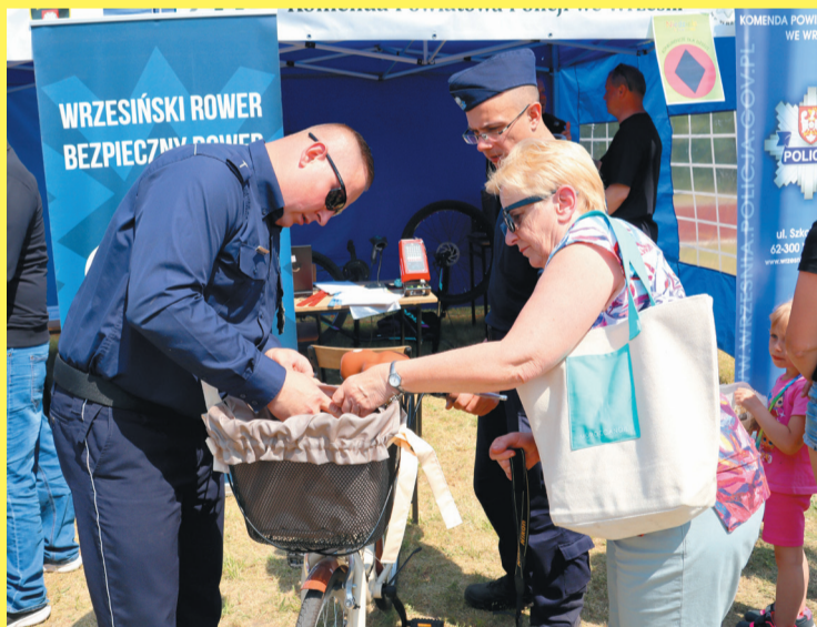
Na stoisku mundurowych znakowano rowery