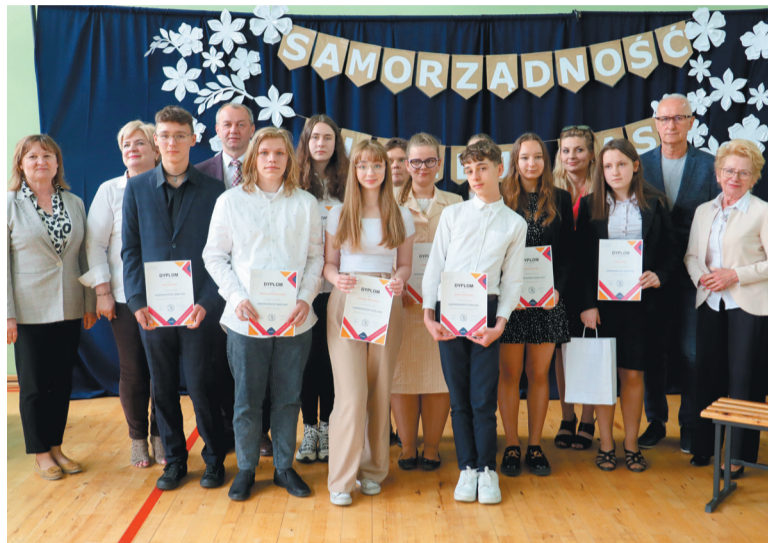
Laureaci z organizatorami

2 czerwca w Samorządowej Szkole Podstawowej nr 3 we Wrześni odbyło się uroczyste wręczenie nagród laureatom powiatowego etapu VI konkursu „Samorządność bliżej Nas”.