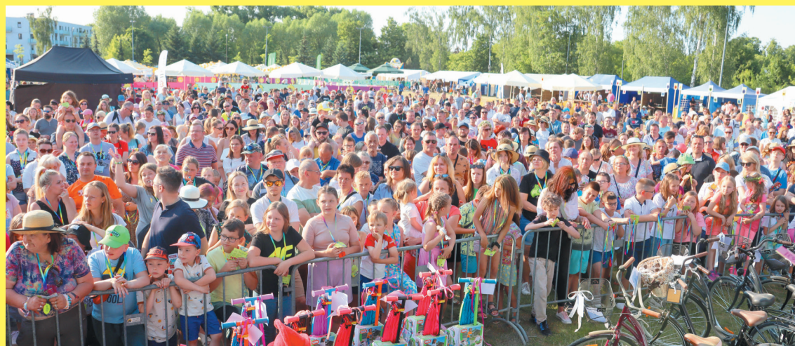
Cieszyła piękna pogoda i świetna frekwencja