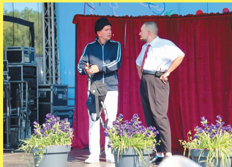
Mieszkańcy powiatu kochają kabarety