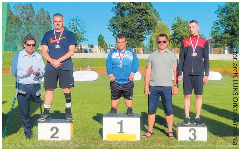
Wychowanek wrzesińskiego Orkana nie miał sobie równych