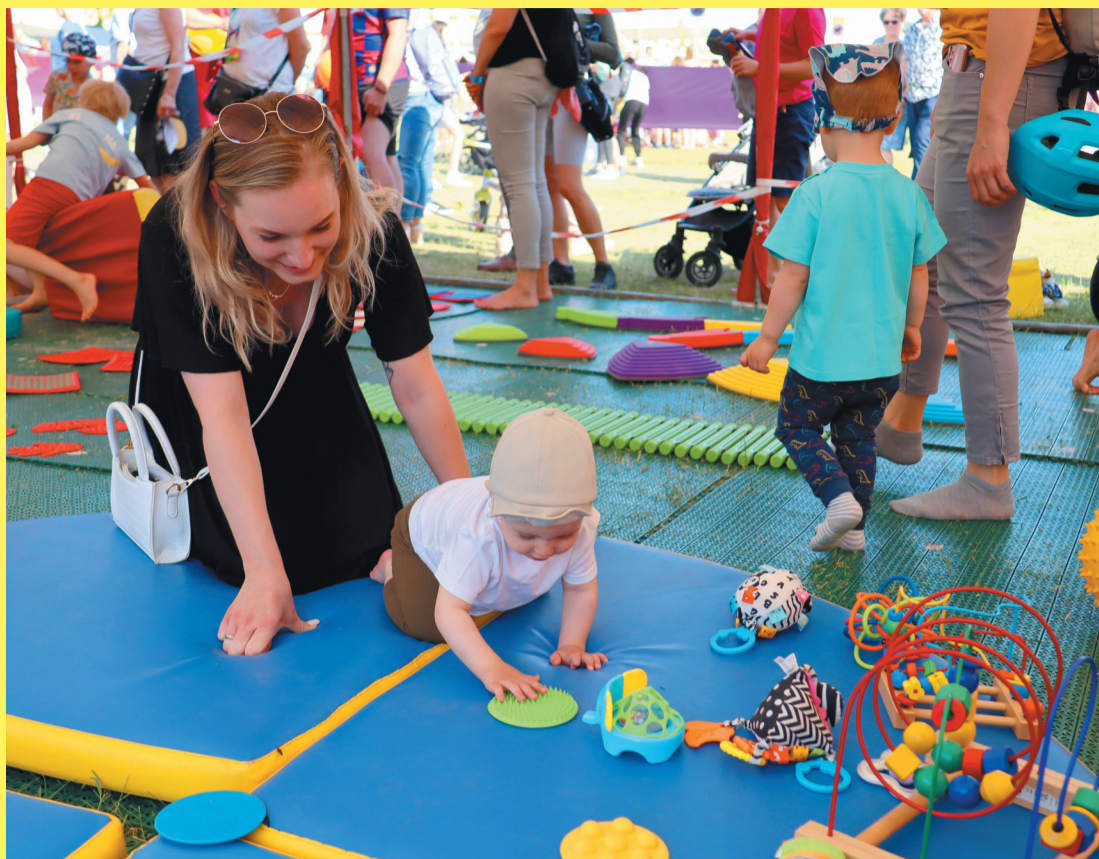
Dla dzieciaków przygotowano mnóstwo atrakcji, m.in. chatkę sensoryczną