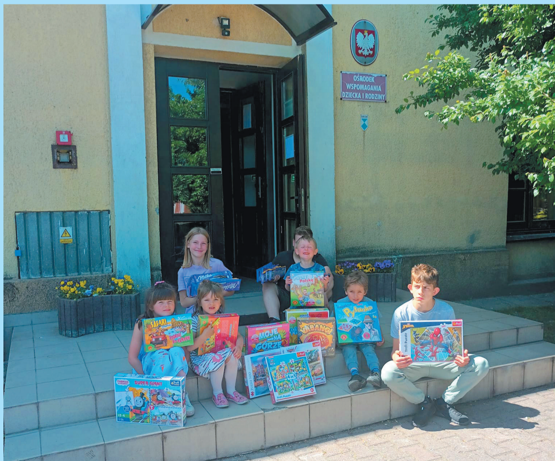
Z nowymi grami w OWDiR-ze nikt nie będzie się nudził