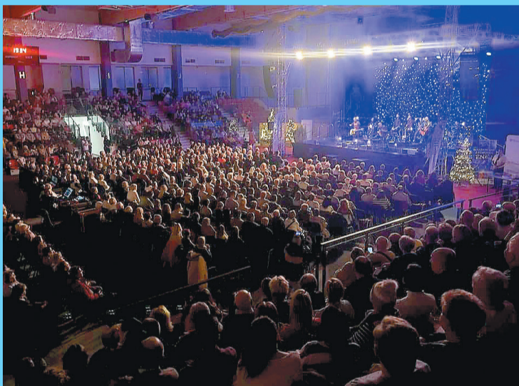
Hala przy ul. Wojska Polskiego wypełniła się po brzegi