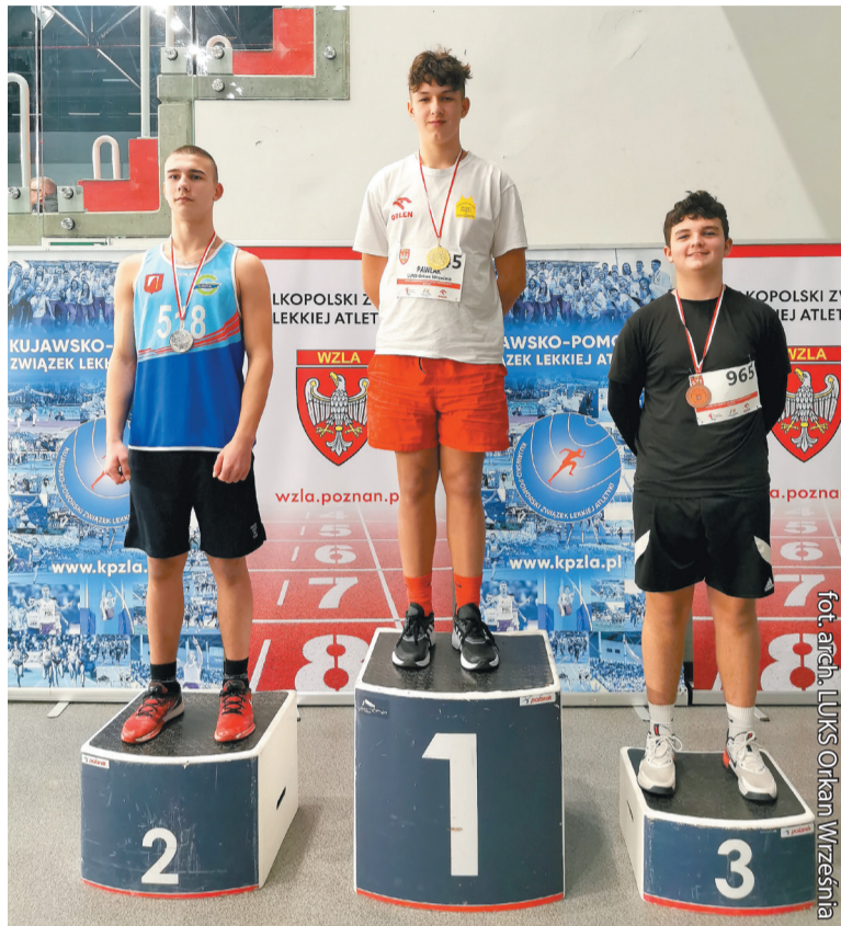
Zdobyć podium to dla sportowców duma i zaszczyt