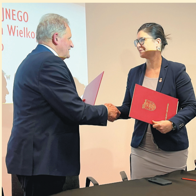
Moment zawarcia listu intencyjnego