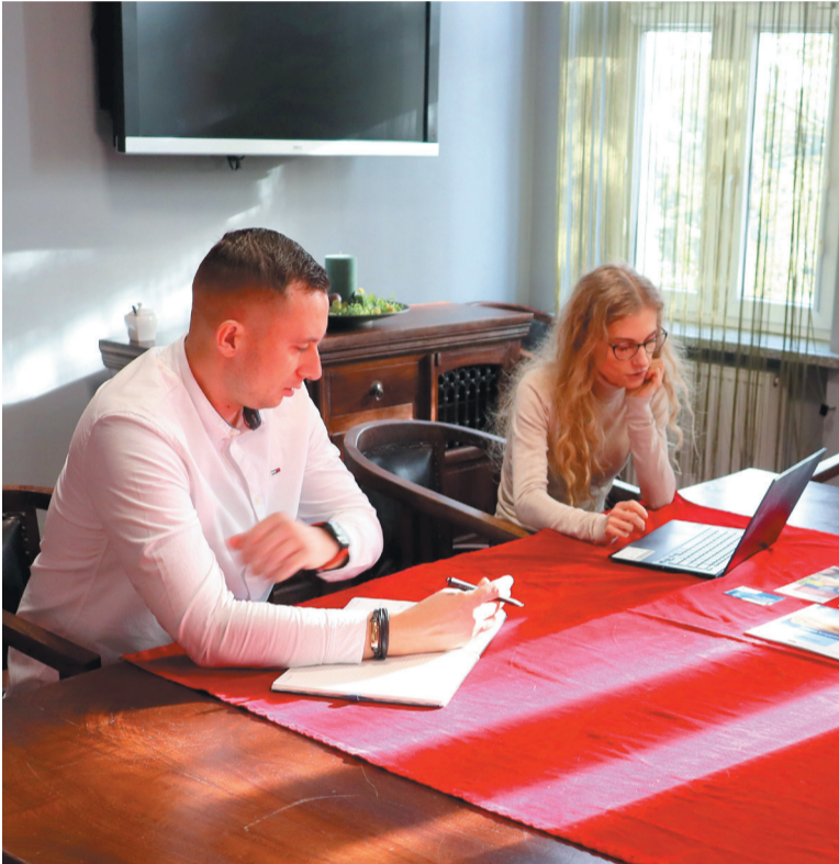
Z konsultacji mogli skorzystać mieszkańcy zainteresowani pozyskaniem środków