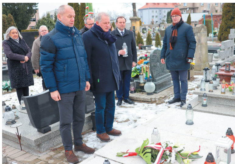
Pamięć o bohaterach narodowych jest bardzo ważna