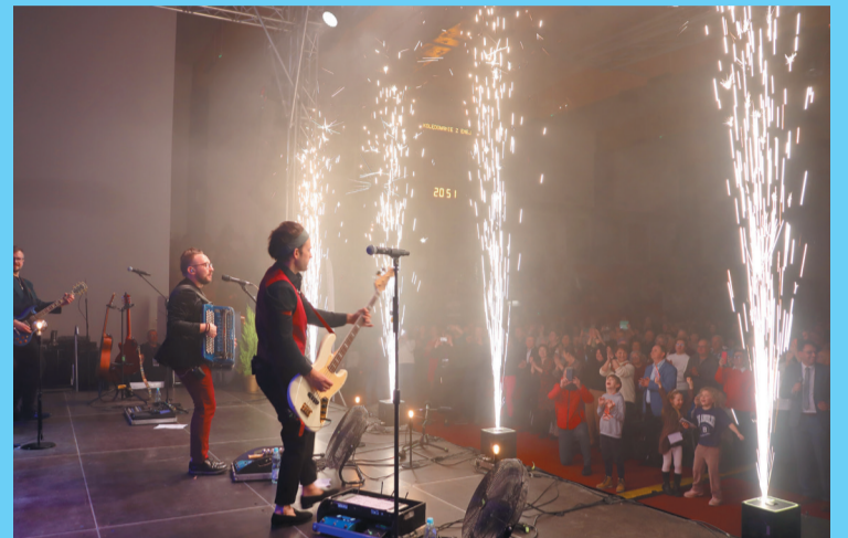
Podczas koncertu artyści niejednokrotnie zaskakiwali słuchaczy