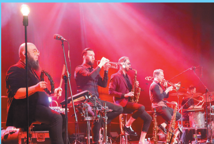
Muzycy wykonywali kolejne utwory w ciekawych i niespotykanych aranżacjach