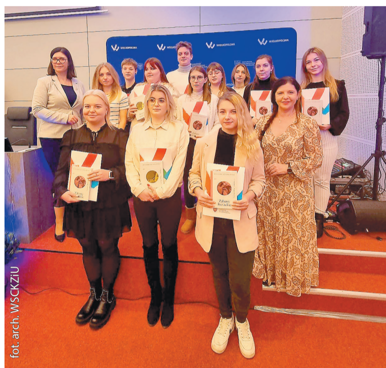
Zdolni słuchacze wrzesińskiego WSKZiU w UMWW