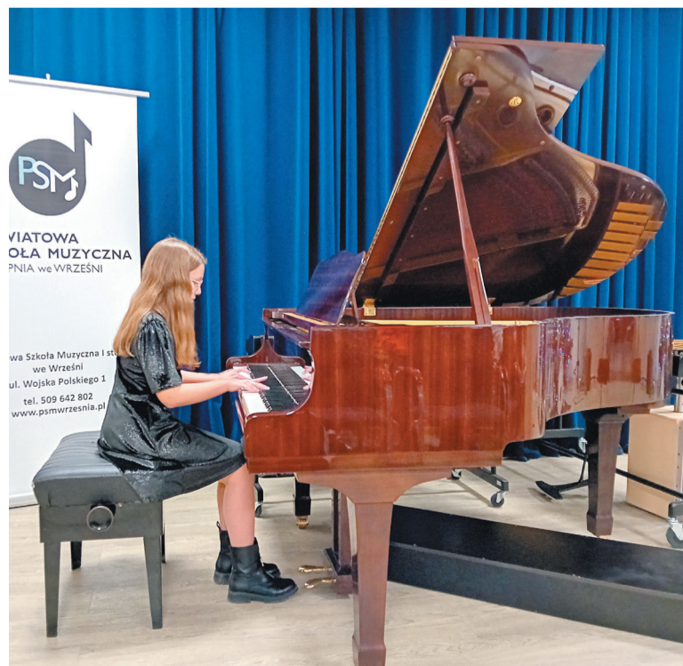
Koncert na rzecz WOŚP to kolejna inicjatywa Szkoły Muzycznej we Wrześni