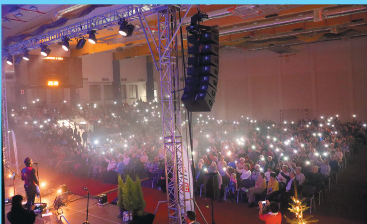
Uczestnicy kolędowania często włączali się do wspólnego śpiewania