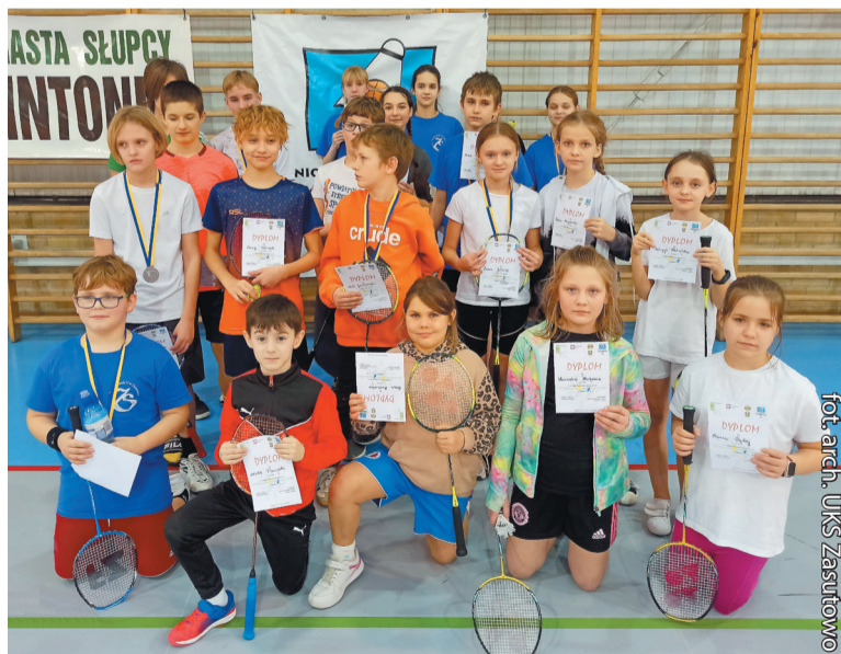
Z medalami i dyplomami