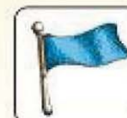
potrzeba pomocy medycznej