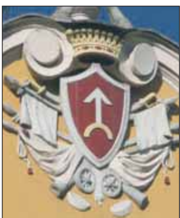
Herb Ogończyk rodziny Żółtowskich z koroną hrabiowską, kościół w Nekli

bowie osadnictwo zanikło. Centrum władzy państwowej przeniesione zostało do Krakowa. W XI, XII i na początku XIII w. teren dzisiejszej ziemi wrzesińskiej znajdował się w oddziaływaniu grodów w Biechowie oraz Gieczu, Gnieźnie i Łądzie. Niektórzy, jak J. Stasiewski, upatrywali w dawnej kasztelanii biechowskiej praojca powiatu wrzesińskiego. Jednak do dziś wśród badaczy zdania o charakterze tej kasztelanii są podzielone. Uznaje się ją m.in. za część składową kasztelanii gieckiej. Stopniowo zadania gospodarcze, społeczne oraz administracyjne grodu w Gieczu od poł. XIII w. zaczęły pełnić powstające miasta w Środzie oraz Pyzdrach. Znaczący wpływ miały na to zmiany tras szlaków handlowych. Straciła na znaczeniu stara droga z Poznania przez Giecz, Biechowo, Łąd na