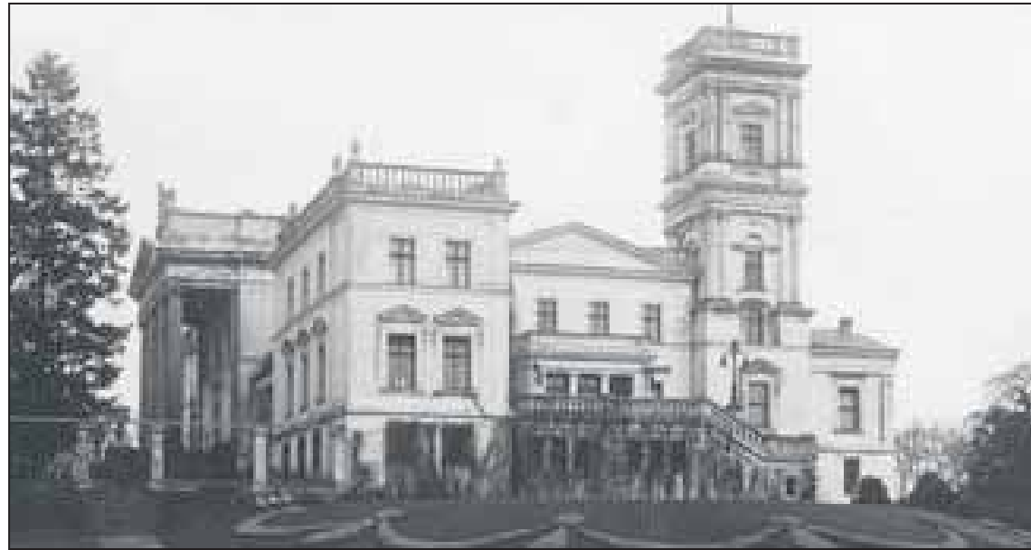
Pałac w Miłosławiu, widok z pocz. XX w.