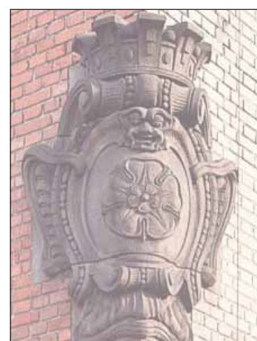
Kartusz herbowy na ratuszu wrzesińskim, u góry korona hrabiowska

Miasta jako swoje symbole przyjmowały tarcze herbowe z godłami. Często miasta prywatne przyjmowały za swoje znaki herby właścicieli. Takim przykładem jest herb Wrzesni, rodowy znak Porajów, pierwszych właścicieli. Wrzesnia jako herb używała także od 1671 herbu Działyńskich – Ogończyk, by w XIX w. powrócić do pierwotnego. Po otrzy-