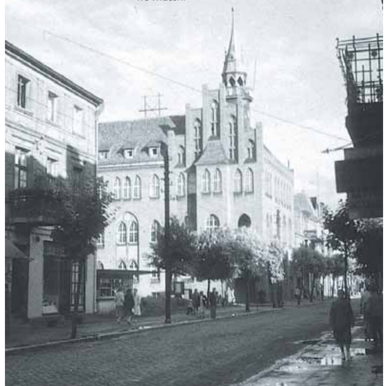
Widok w kierunku ratusza od ulicy Jana Pawła II (wtedy Obrońców Stalingradu), koniec lat 50.