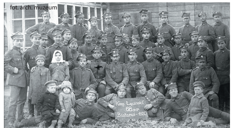
Kompania łączności 68. Pułku Piechoty na froncie białoruskim, 1920 r.

W wojnie z Rosją brał również udział 10. Pułk Strzelców Wielkopolskich składający się także z wrzeńskich powstańców wielkopolskich. W czerwcu 1919 roku został wysłany na front ukraiński, a w sierpniu na wołyński. Stamtąd powrócił do Wielkopolski, gdzie stacjonował w Krotoszynie zabezpieczając granicę z Niemcami. 1 lutego 1920 roku pułk otrzymał nazwę 68. Pułk Piechoty i wszedł w skład 17 Dywizji Piechoty. W maju pułk został wysłany do Mołodeczna na front litewsko-białoruski. Tam brał udział w licznych krwawych bitwach: pod Kowalami, Matjasami, Puzyrami, Sadykierzem. W sierpniu 1920 roku brał udział w Bitwie Warszawskiej. Stoczył boje o Dębinki, Morgowo, Morgi i Nasielsk. Po zakończeniu walk pułk pełnił służbę na linii demarkacyjnej z Litwą.