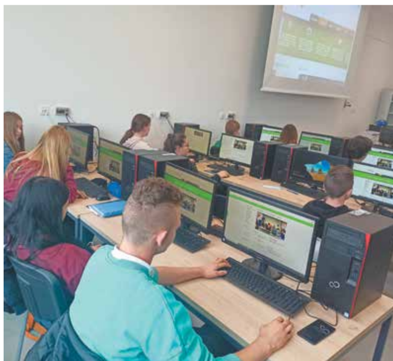
Powiat realizuje projekt, który ma przygotować uczniów do realiów współczesnego rynku pracy

kształcenie fachowców!”. Pakiet ten oparto na systemie informatycznym klasy ERP, odzwierciedlającym procesy zachodzące na co dzień w działalności przedsiębiorstw logistycznych. (red.)