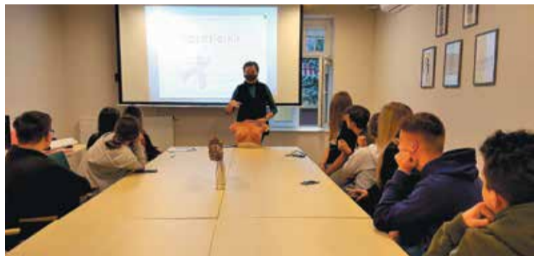
Profilaktyka chorób nowotworowych jest bardzo ważna