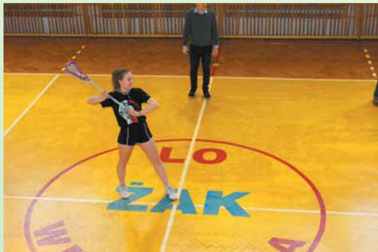
Zawodniczka UKS Żak podczas ćwiczeń

Ludzie biegnący po trawiastych boiskach, trzymający w rękach kije zakończone siatkami to widok, który może kojarzyć się ze zbiorowym polowaniem na latające owady. Jednak nie o polowanie skrzydlatych insektów tu chodzi, lecz o sport z niezwykle bogatą tradycją, który zyskuje coraz większą popularność na świecie. Lacrosse, bo o nim mowa, od niedawna coraz bardziej znany jest również mieszkańcom powiatu wrzesińskiego.