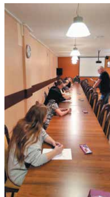
Treść dyktanda dotyczyła kwestii ekologicznych

Nagrody przekazane przez Starostwo Powiatowe we Wrześni wręczono zostały w dniu 15 października.