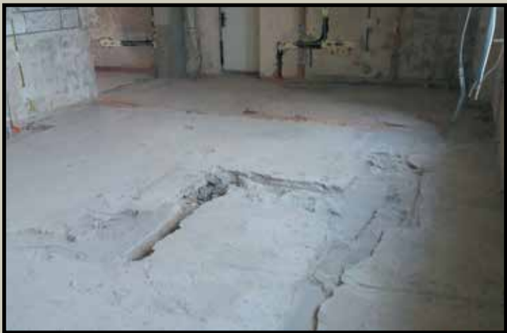
Przygotowywanie łazienek do montażu instalacji sanitarnych