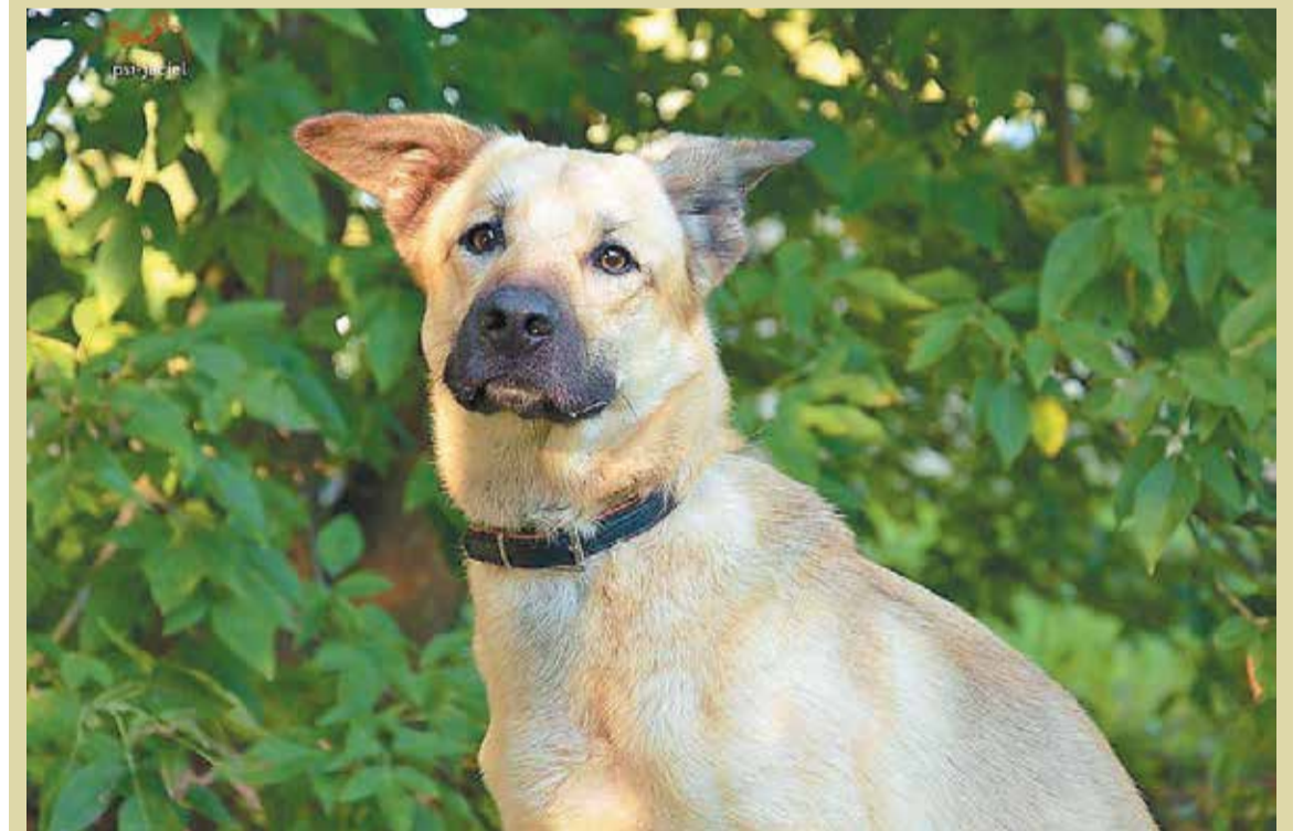
Frugo, chociaż jest młodym i energicznym psiakiem, uczy się pokory