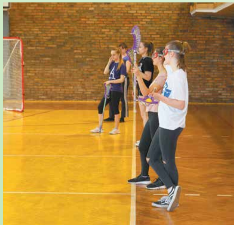
Jedyna lokalna drużyna lacrosse trenuje od ponad roku