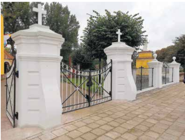
Przestrzeń wokół neklińskiego kościoła robi wrażenie

Przedstawiciele Wojewódzkiego Urzędu Ochrony Zabytków w Poznaniu odebrali prace przy ogrodzeniu kościoła w Nekli oraz elewacjach i dachach kościoła oraz dzwonnicy w Zielińcu. Zadania były wsparte finansowo z budżetu powiatu wrzesińskiego.