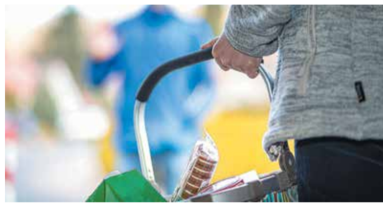
Niewielka pomoc w codziennych sprawach może stanowić dla kogoś ogromne wsparcie