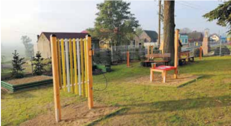
Inwestycja w Pietrzykowie była ostatnią w tej edycji budżetu obywatelskiego

We wtorek 20 października na placu zabaw w Pietrzykowie zakończyły się prace realizowane w ramach budżetu obywatelskiego powiatu wrzesińskiego na 2020 rok.