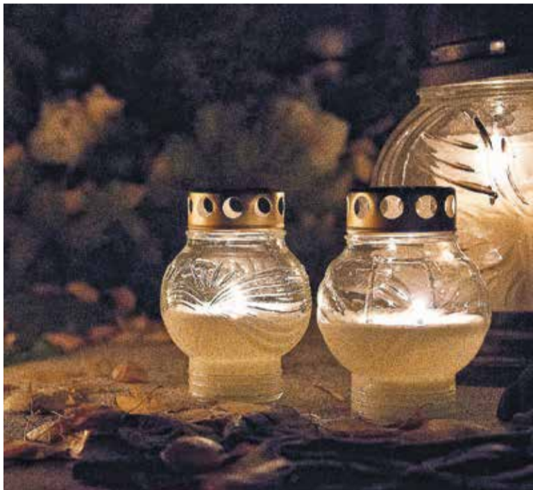
Symboliczny znicz jest wyrazem pamięci o zmarłych

Celebrowane jest w wielu krajach na świecie, jednak każde z państw i wyznań w nieco inny sposób stara się okazać szacunek zmarłym. Oto kilka tradycji, wprost ze świata, związanych ze Świętem Zmarłych.