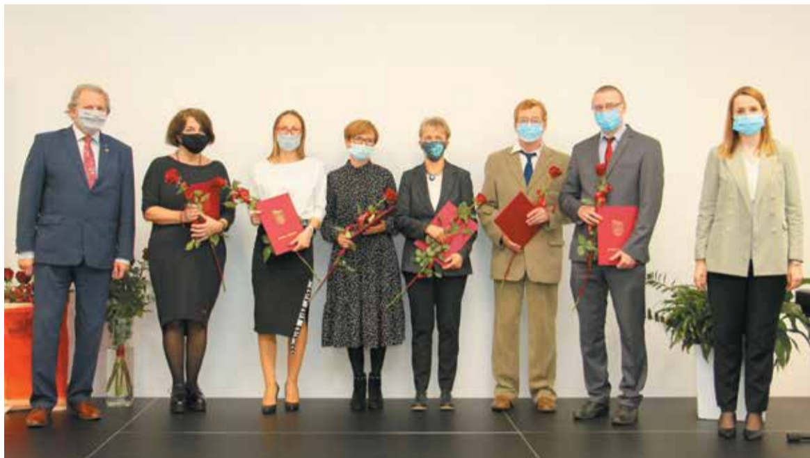
Wręczenie nagród i wyróżnień odbyło się w Centrum Badań i Rozwoju Nowoczesnych Technologii