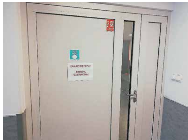
Niepozorne wejście do szpitalnej czerwonej strefy

Sytuacja epidemiczna w Polsce staje się kryzysowa. Tzw. oddziały covidowe powstają więc w całym kraju