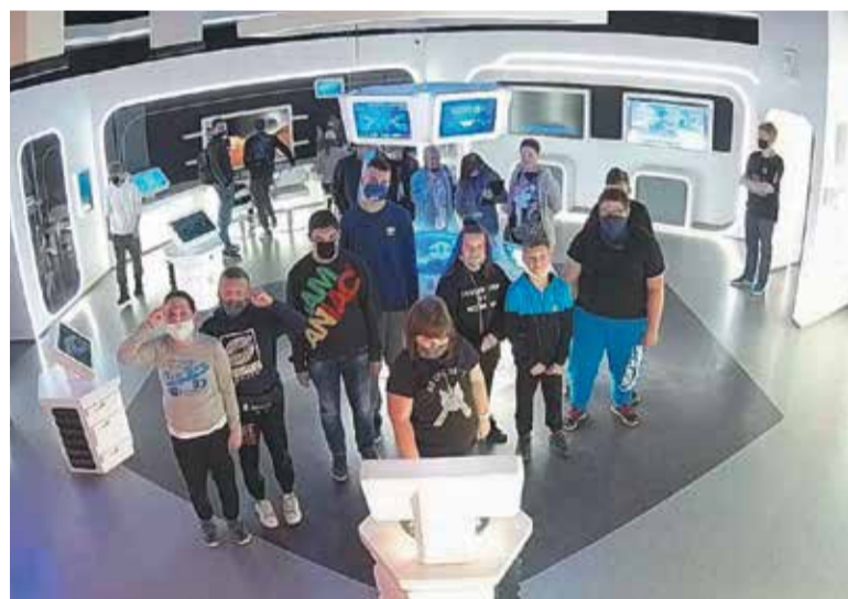
Atrakcje w planetarium były świetnym połączeniem nauki i rozrywki

Grupa uczniów Zespołu Szkół im. Janusza Korczaka na początku października wybrała się do planetarium w Toruniu.