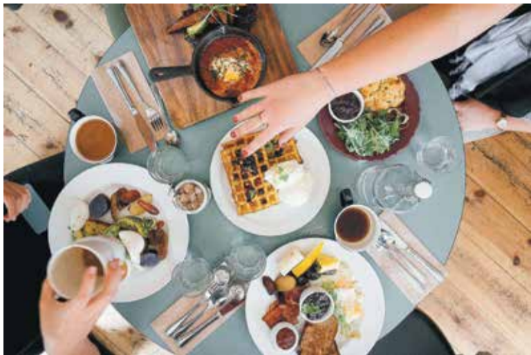
Podczas wspólnego spożywania posiłków obowiązują nas wiele zasad dobrego wychowania

pamiętać także o tym, by nie opierać łokci o stół. Najlepiej będzie, gdy oprzemy o niego wyłącznie dłonie (maksymalnie do wysokości nadgarstków). Należy także zachować wyprostowaną sylwetkę, ponieważ pochylanie się nad talerzem wygląda nieelegancko – to jedzenie powinno trafiać do naszych ust, nie odwrotnie. Jeśli chcemy uniknąć kopania kogoś pod stołem, nie zakładamy nogi na nogę. Najlepiej ułożyć obie stopy na ziemi, równoległe do siebie. Nie trzeba chyba przypominać, że nie mówimy z pełnymi ustami i pijemy tylko wtedy, gdy przełknijemy już jedzenie. Nie gestykulujemy, trzymając sztućce w dłoniach, a zwracając się do innych gości, nie podnośmy głosu. Najlepiej rozmawiać z tymi, którzy siedzą najbliżej nas. Oczywiście wszystkie telefony komórkowe powinny być wyciszone.