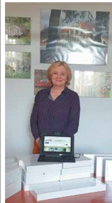
Nowy sprzęt to wsparcie w nauce na odległość

Liceum Ogólnokształcące im. Henryka Sienkiewicza we Wrześni zostało wytypowane do otrzymania Szkolnych Pakietów Multimedialnych z puli MEN.