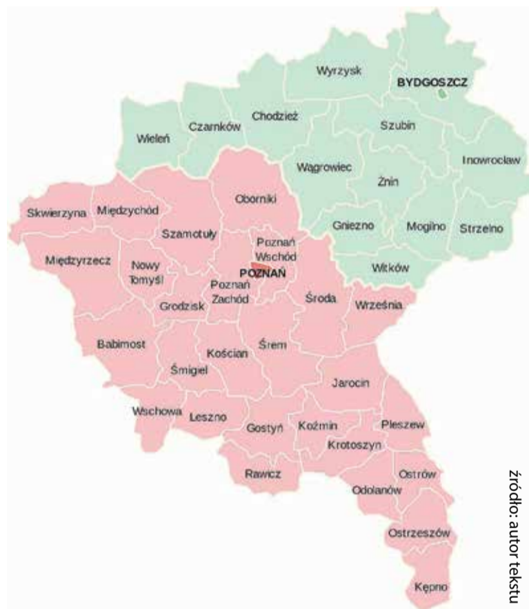
Mapa Wielkiego Księstwa Poznańskiego (Prowincji Poznańskiej) po 1886 roku, podział na regencje i powiaty po zwiększeniu ich liczby

Od początku swego panowania Prusy dążyły nie tylko do zwykłego, administracyjnego wcielenia zabranych ziem do swego państwa, ale do ich metodycznej, stopniowej germanizacji, czyli zniemczenia. W latach 1793-1871 (z przerwą w latach 1807-1815, kiedy Wielkopolska znajdowała się w granicach Księstwa Warszawskiego) germanizacja była wewnętrzną polityką Prus. Po 1871 roku, w którym Prusy dokonały zjednoczenia państw niemieckich pod swoim przywód-