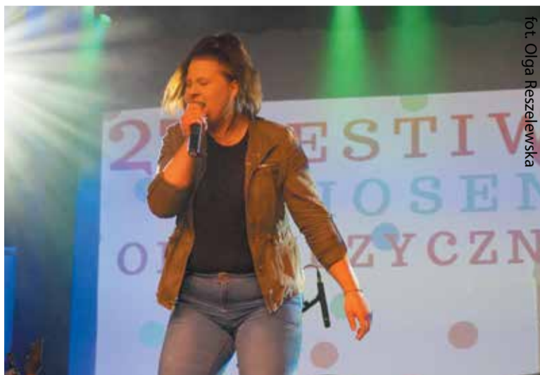
Emocjonujący występ solo...