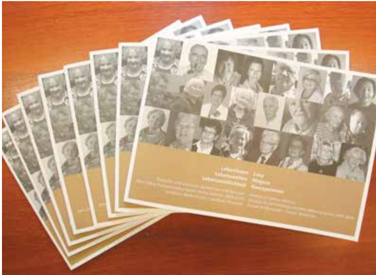
Publikacja udostępniana jest nieodpłatnie

Jednym z filarów współpracy powiatu wrzesińskiego z niemieckim powiatem Wolfenbüttel jest projekt „Aktywny Senior”. Wymiana seniorów z obu regionów trwa już ponad dekadę. Z tej okazji ukazała się publikacja, którą zainteresowani mogą otrzymać nieodpłatnie.