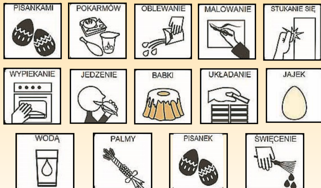
Rozwiązanie: Malowanie pisanki; Oblewanie wody; Jedzenie jajek; Układanie palmy; Świecenie pokarmów; Wypiekanie babki; Stukanie się pisankami