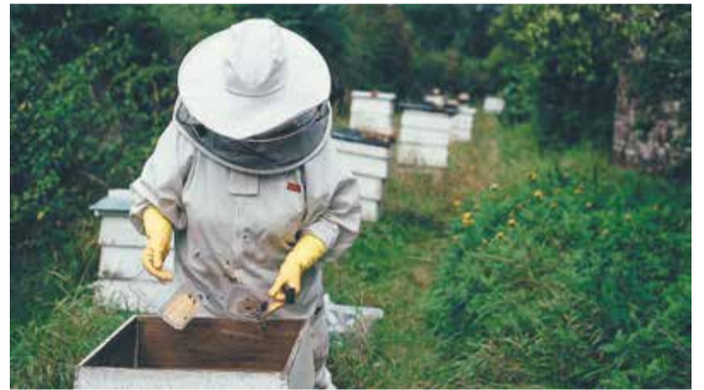
Dobrze jest spędzać wolny czas w sposób dający prawdziwą satysfakcję

Pierwszą i najważniejszą kwestią, zupełnie najistotniejszą dla początku tej przygody, bez której nie sposób