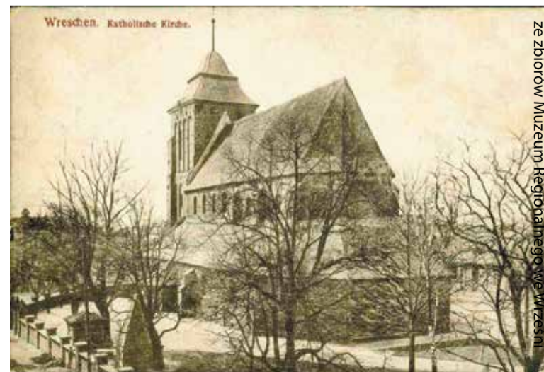
Kościół katolicki (fara) we Wrześni na początku XX wieku

Zasadniczy przełom przyniósł rok 1815 i następane lata. Co prawda Prusy poniosły znaczne straty terytorialne na ziemiach polskich na rzecz Rosji (m.in. wschodnią Wielkopolskę