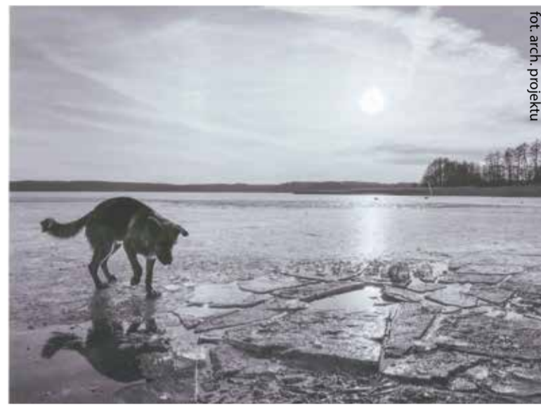
fot. arch. projektu

Znany rozstrzygnięcie XV Jubileuszowego Ogólnopolskiego Konkursu Fotograficznego „Świat w obiektywie” organizowanego przez Ośrodek Wspomagania Dziecka i Rodziny w Kołaczkwie. Jury obradujące 9 marca przyznało nagrody i wyróżnienia autorom najlepszych zdjęć.