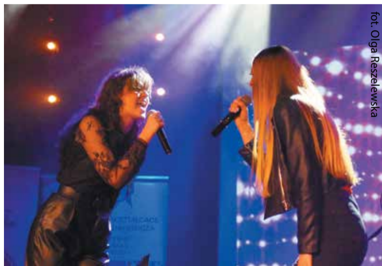
...i w duecie