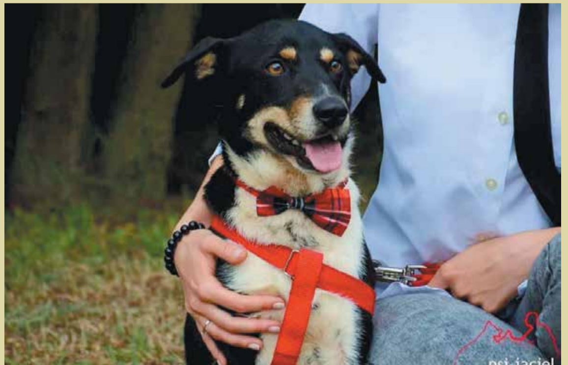
Max szuka domu, w którym zostanie już na stałe.