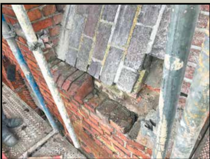
Prace na wieży

Informujemy, że kolejny numer „Przeglądu Powiatowego” ukaze się 16 kwietnia