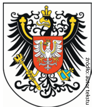
Herb Wielkiego Księstwa Poznańskiego

twem, germanizacja stała się działaniem ogólnoniemieckim.