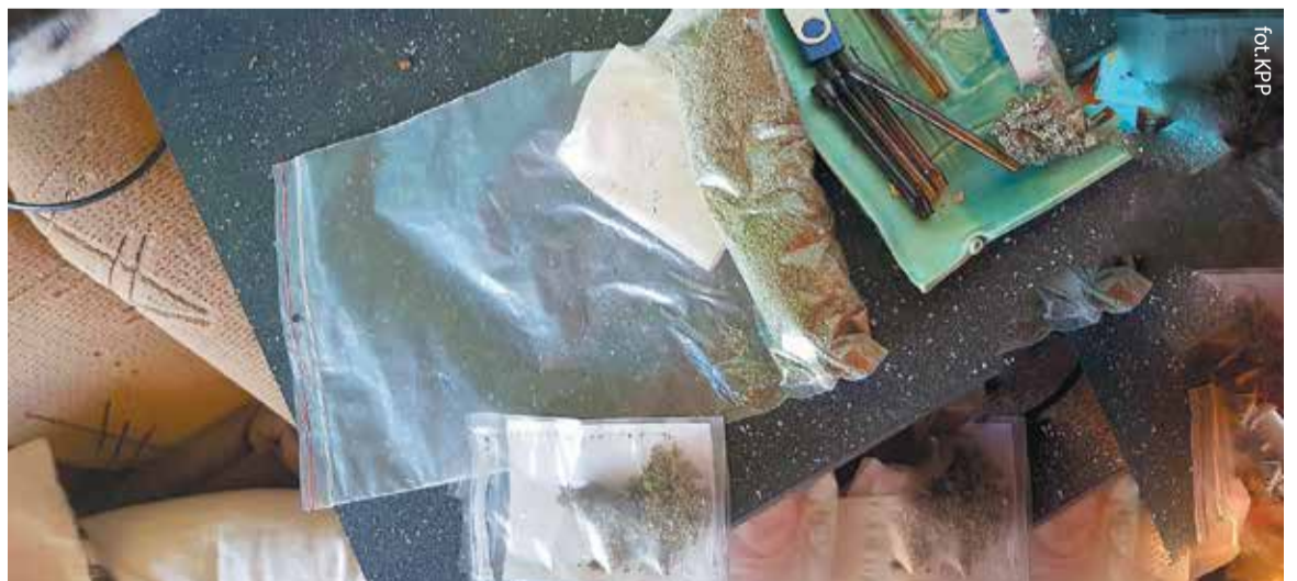
Dowody w sprawie