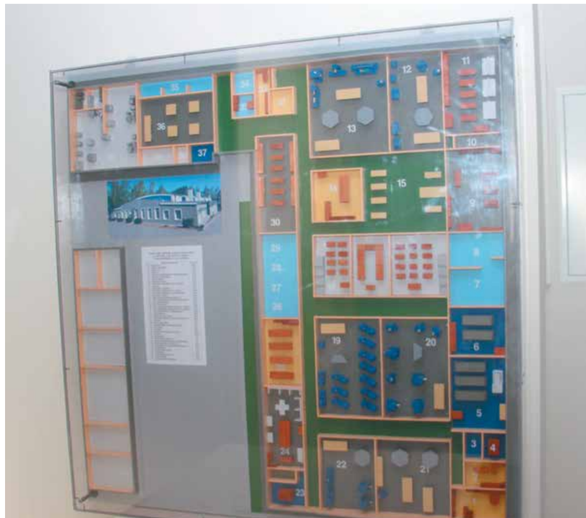
Makieta Powiatowego Centrum Edukacji Zawodowej we Wrześni obejmująca powstające właśnie nowe pracownie