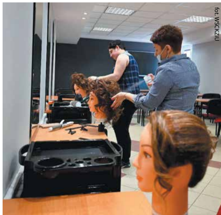
Drzwiom Otwartym towarzyszył m.in. pokaz fryzjerski